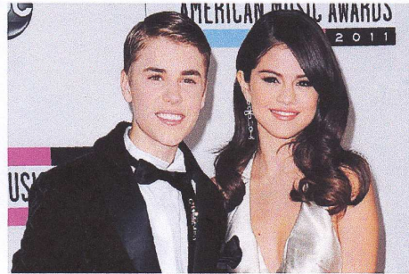
Justin Bieber Selena Gomez

Mais si je les rencontre ça sera séparément évidemment