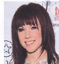
Carly Rae Jepsen

Justin Bieber à fait un duo avec elle et il est également très très fan d'elle comme moi sa serait trop d' E•MO•TION de la rencontrer.